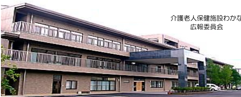
介護老人保健施設わかな 広報委員会