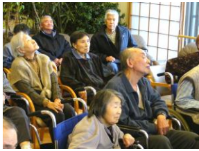
▲大きなマグロに釘付け