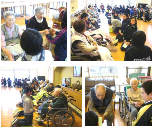
▲お話に熱中されている様子

春暖の候、うらかな季節 を迎え、皆様いかがお過ごし でしよ。か。 本年度も年4回の定期発 信にて、皆様に情報発信をし て参ります。