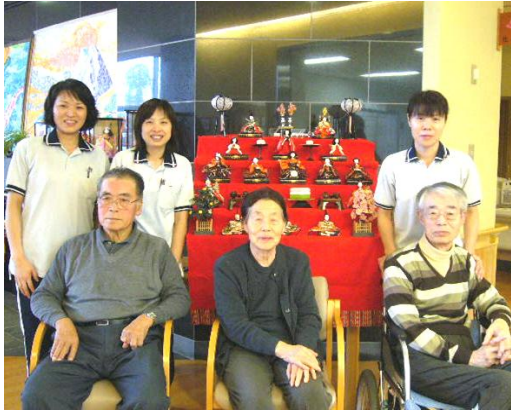
▲お雛様の前で記念撮影