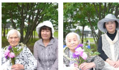
青空の下、爽やかな空気で大きく深呼吸