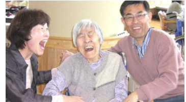
▼ 笑顔はじける家族団欒のひとつき

四月二十三日、御家族様を招き、お花見会食会が開かれました。てまり寿司をはじめ、鱈の西京焼き・うどの酢味噌和え・筍の土佐煮・あんかけ茶碗蒸し・さくら寄せ等、季節の御食事を堪能されていらっしやいました。 総勢八十名の御利用者様・御家族様を迎えての盛大な会食会となりました。