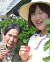
▲▼みはらしファームにて集合写真