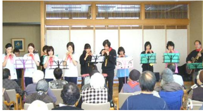
練習の成果を御利用者様の前で披露！