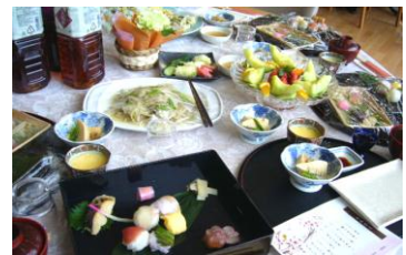
▲ 彩り豊かな季節の御食事