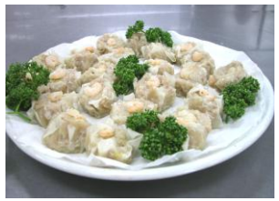
▲四月 手作りエビシユウマイ