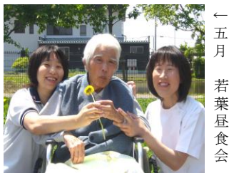
← 五月 若葉屋食会

四月十九日に行われました記念すべき第一回目の【お花見屋食会】では、生憎のお天気となってしまいましたが、お部屋に桜の花を飾り、春の空気を感じられた一日となりました。