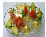
フルーツ 梅酒ゼリー