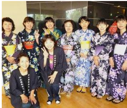
▲第三回 わかな夏祭りへようこそ♪

九月三日(土)、「第三回 わかな夏祭り」が盛大に開催されました。台風の影響が心配されていたため、ご家族様・ボランティアの皆様をお招きし、本年度は、初めて施設内で午後からの運びとなりました。