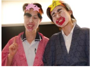
▲▼笑顔の彦星と織姫