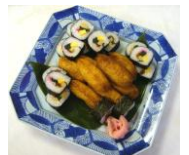
いなり寿司 巻き寿司