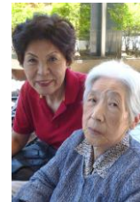
【七夕昼食会】 七月十二日(火)