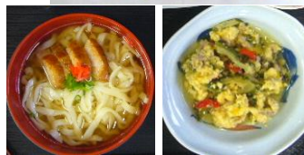
▲七月 ソーキそば・ゴーヤチャンプル