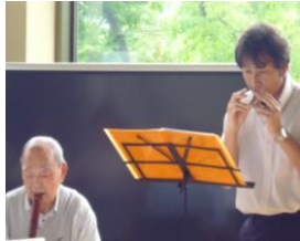
▲尺八とコカリナのハーモニー