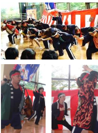
▲迫力あるソーラン節