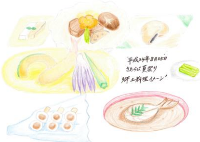
管理栄養士によるイラストイメージ