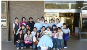
平成24年4月 送別の日

平成23年6月 長野県を通じ宮城県からの応援要請を受け、宮城県気仙沼市に介護職員の被災地派遣（避難所）を行いました。